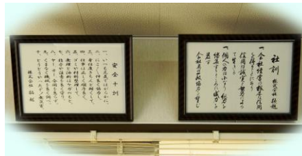
とても大事なもの！！ 安全十訓と、社訓が壁に掛けてありました。

長岡出張所が移転しました。 出張所が出来た時は、所長からのメッセージのみ掲載し、訪問しなかったのですが、今回は機会がありました。移転先を訪問することが出来ました。 場所は、長岡市三ツ郷屋(案内図参照)。住宅地なので、わかりにくいかも知れませんが、近くに行くと、「チャレンジ・・・」の幕が目飛び込んできて、「オー！ 拓越だ！」と何だか仲間を見つけた気分嬉しくなりました。(だって、長岡市に出張所だよ。次は、新潟市かな？なんてね。) 勝手に想いが暴走してすみません。・ と云うことで、それではおじやまさせて頂きます。 まず、ドアの方じゃなくて、掃き出し窓の方の玄関を入ると、可愛い招き猫がお出迎えしてくれました。