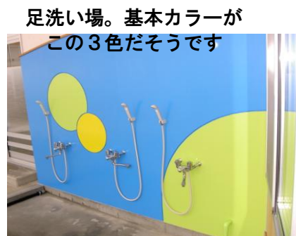
足洗い場。基本カラーがこの3色だそうです