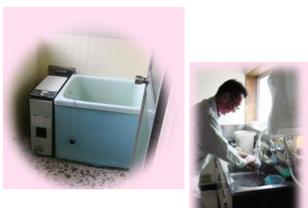
お風呂もキッチンもあるので、残業や早出に対応出来て便利です。