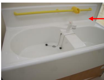
沐浴用洗い場です。こんなのも設置されていくつくり